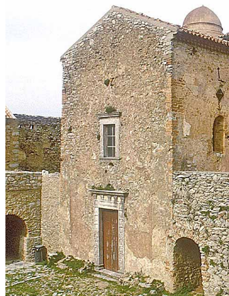
Monastero di San Filippo di Fragalà • Frazzanò (ME) Veduta esterna dal chiostro e particolare